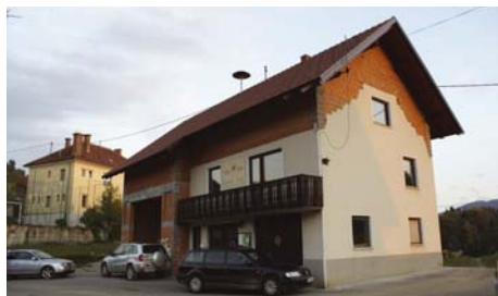
Gasilski dom urejajo, v njem pa prostor za orodno vozilo in dvorano.