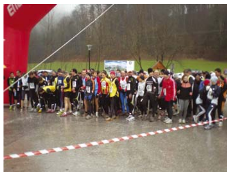
Kljub dežju je bilo na startu 140 tekačev

Tekačice in tekače na daljši razdalji je pot izpred Term Snovik vodila po pešpoti skozi vasi Snovik in Hruševka ter nato po makadamski poti na vrh k cerkvi sv. Miklavža. Nekaj več kot dvaindvajset minut je za pet kilometrsko progo (5360 m) in 295 metrov višinske razlike potreboval