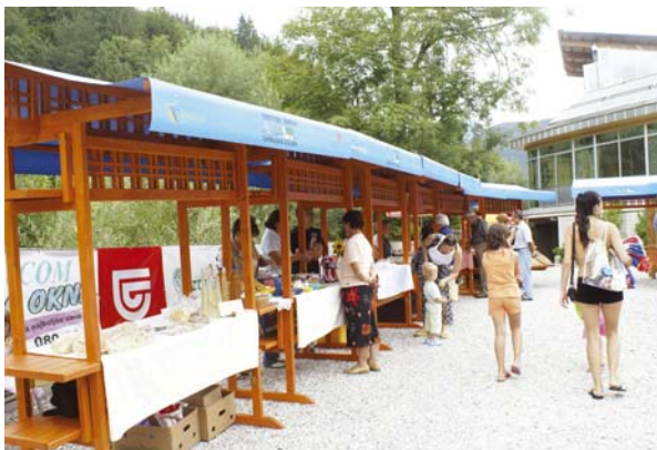
Prodajo na stojnicah že imamo Termah Snovik vsak četrtek med 11. in 16. uro.

Turistično društvo Tuhinjska dolina se je na srečanju IZKUŠNJE Z OSJO LEADER