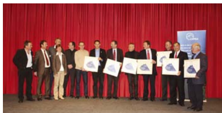
Dobitniki nagrad na podelitveni svečanosti v Bernu 6. novembra