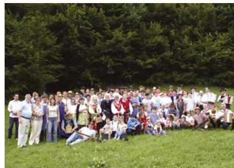
Pa še posnetek udeležencev v prikazu spominov.

Ob pregledu tridnevnihih sprehajanj po poteh nekdanjih spominov v Tuhinjski dolini se mi je v prisposodbo ocene prikradla misel: