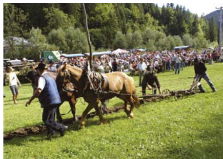
»Traktor« z dvema konjskima silama je sklenil prikaz spominov.