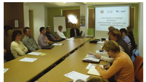
Oktobra je bila prva delavnica v okviru projekta

Ker bomo dobili le manjši del potrebne denarja, bomo pripravljene projekt uresničevati postopoma in odvisno od občinske denarne pomoči.