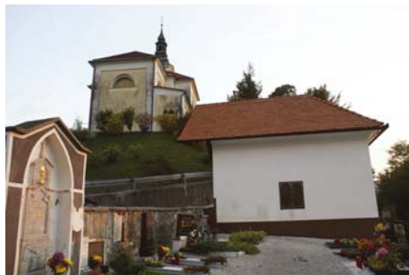
Za ureditev mrliških vežic že imajo načrte.

V programu krajevne skupnosti je urejanje cest. Predsednik KS Milan Hribar: »Želimo si in se trudimo, da bi bile cestne povezave med kraji boljše, za kar bi morali urediti in asfaltirati še nekaj kilometrov cest...«