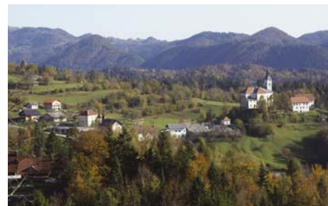
Pogled na Sela