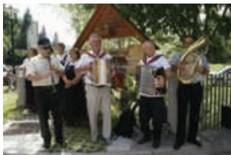
Za prijetno razpoloženje pred razglasitvijo najboljših so poskrbele pevke in muzikantje