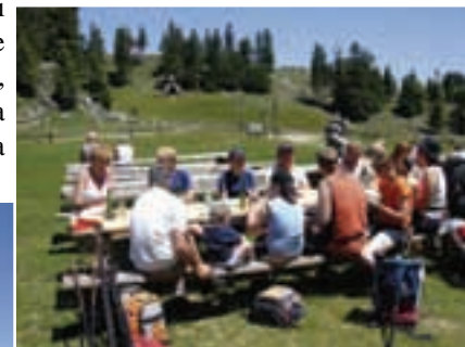
Zaslужeni počitek in okrepčilo pri Domu na Menini planini