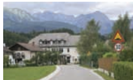
Za varno pot: pločnik od gasilskega doma do šole