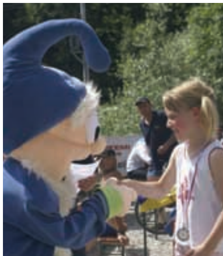
Najmlajšim najboljšim je čestital tudi palček Snoviček.