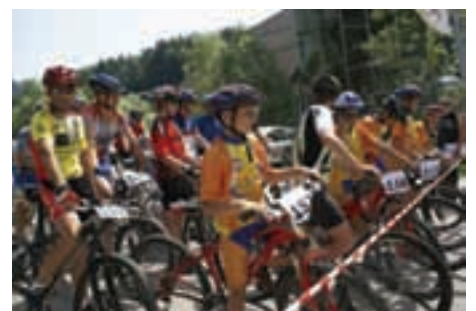
Na startu obeh vzponov in dirke je bil prek 100 kolesarjev.