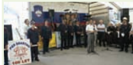
Ob 100-letnici je gasilce v Šmartnem nagovoril tudi minister za obrambo Karl Erjavec