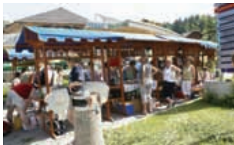
Na stojnicah so članice društva ponudile dobrote iz Tuhinjske doline.